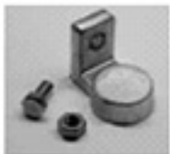
"L" Terminal (LT)

Die angegebenen elektrischen Werte gelten für Belastungen aus vollgeladenen Zustand und einer Umgebungstemperatur von 20° C.