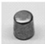
Automotive Post (AP)