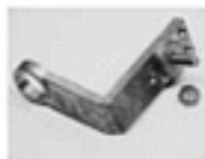
Bus Terminal (BT)